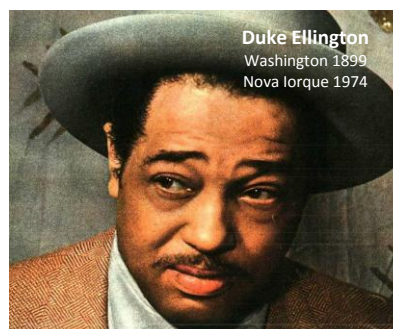
Duke Ellington Washington 1899 Nova Iorque 1974

Se não é alérgico ou intolerante, estas substâncias ou produtos são inofensivas; Para uma informação adicional, deve solicitar esclarecimentos junto de um colaborador; A declaração nutricional apresenta-se em função da captação prevista para cada dose individual. É disponibilizada fruta da época como alternativa ao doce.