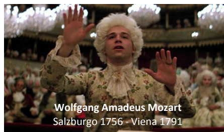
Wolfgang Amadeus Mozart Salzburgo 1756 - Viena 1791

"Forgive me, Majesty. I am a vulgar man! But I assure you, my music is not."